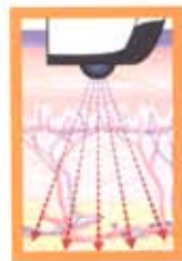
Unipolaris technika működési elve